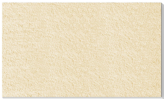
Artikel-Nr. 502 SK