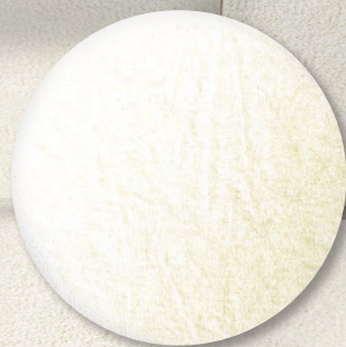
Nr. 514 SK creme