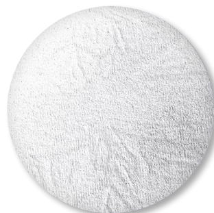
Nr. 512 SK light grey