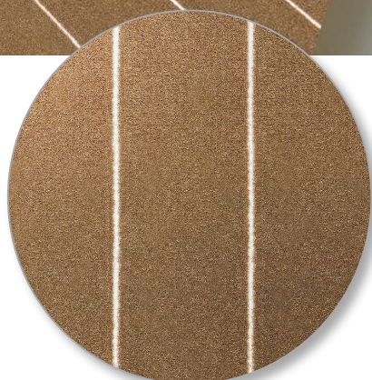
Nr. 808 velours beige