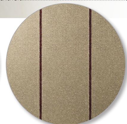
Nr. 830 velours sand