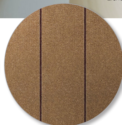
Nr. 840 velours teak