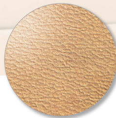
Nr. 6606 caramel