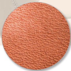
Nr. 6636 orange