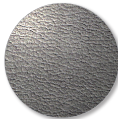
Nr. 6695 grey