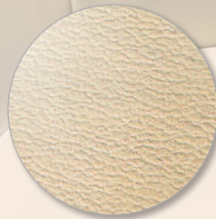
Nr. 6607 beige