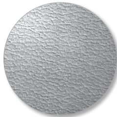
Nr. 6694 aluminium