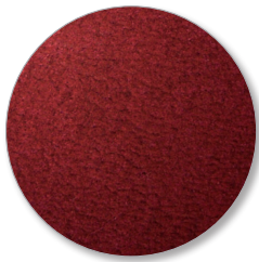
Nr. 6632 bordeaux