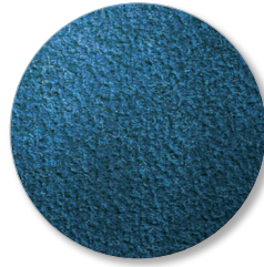
Nr. 6643 sky