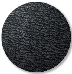
Nr. 6696 anthracite