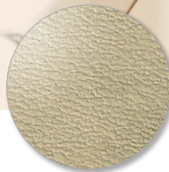
Nr. 6608 desert