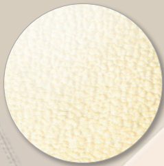
Nr. 6601 creme white

lieferbare Breite ..... ca. 1,40 m Gewicht ..... ca. 470 g/m 2 Material Oberseite .....100% Microfaser Scheuerfestigkeit .....ca.90.000 Touren Lichtechtheit DIN EN ISO 105-BO2..... 5-6