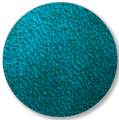
Nr. 6642 turquoise