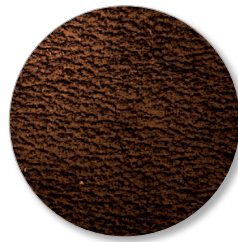
Nr. 6692 chocolate