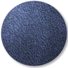
Nr. 6665 royal blue